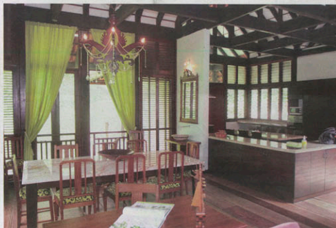
Usus kayu mengusul ruang.

ini menonjolkan 100 peratus kayu bermula dengan lantai, dinding hingga ke siling. Kediaman berasaskan kayu sejuk diduduki kerana berupaya mengangkap pengudaraan," katanya yang turut mengambil inisiatif menaam beberapa spesies balak seperti merbau, cengal, nyatoh, kembang setangkup dan jati di sekitar rumah.