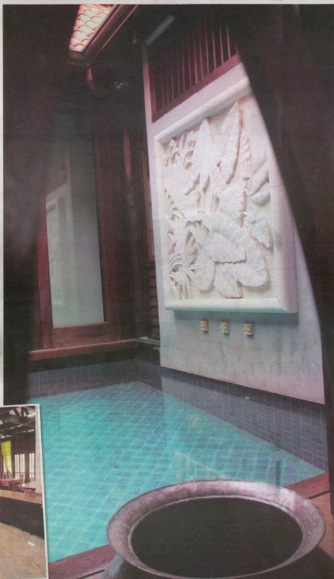
Ruang tengah rumah dilengkapi kolam renang bersama hiasan dinding batu pasir.

■ Oleh Bennie Zie Fauzi bennie@barisan.com.my