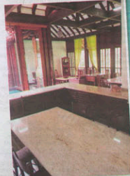
Meja makan berpemulakan grafit.

■ Air takungan hujan digunakan untuk menyiram tanaman sekitar halaman.